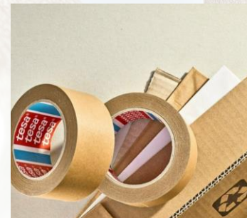
tesa® 4313 Max. 15 kg