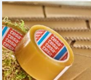
tesa® 60400 Max. 30 kg