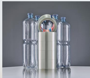
tesa® 60412 Max. 30 kg