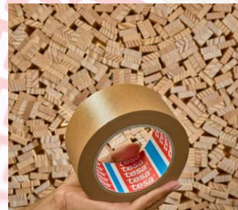
tesa® 4513 Max. 15 kg