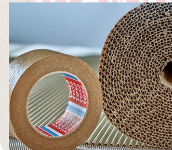
tesa® 60408 Max. 20 kg