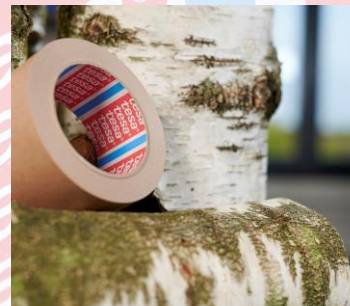
tesa® 4713 Max. 10 kg