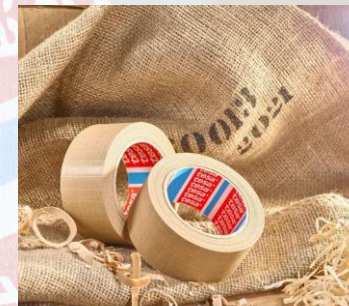
tesa® 60013 Über 20 kg